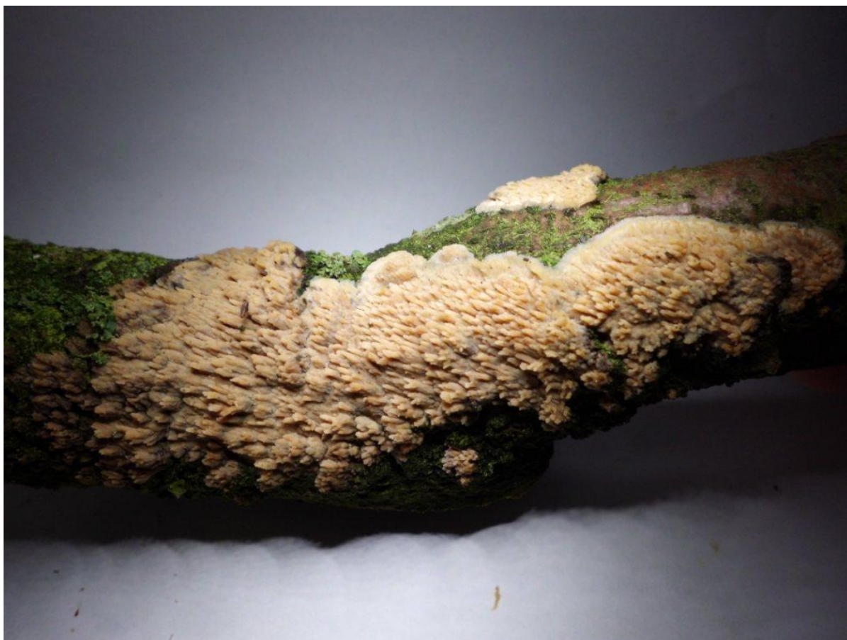
De getande boomkorst

onder de bino begrijp je meteen waar hij zijn naam vandaan haalt