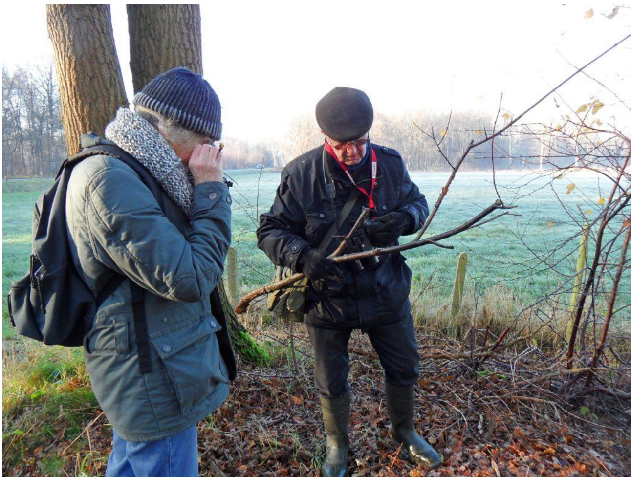
en speurende slobkousen