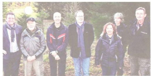
Het gemeentebestuur, Natuurpunt en de 'Slobkousjes' kwamen onder meer deze Ruige ridderzwam (rechts) bewonderen.

Hechtel-Eksel is trots op haar natuur en daarom werd meteen besloten om tot actie